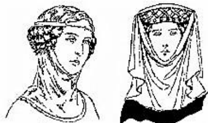
Des tourets, ou gorgets, au XV e siècle.

Les deux hérauts d'armes, qui avaient crié à Chinon « de par les Angevins, Poitevins et Tourangeaux et tous autres chevaliers qui venir y voudront, qu'ils soient armés pour tournoyer », furent chargés de signaler aux spectateurs les origines et les faits d'armes de chaque combattant, car de par leur fonction ils connaissaient parfaitement les armoiries. Ce sont eux qui présentèrent les champions aux juges et qui notèrent lors des épreuves les faits d'armes les plus glorieux de chacun.