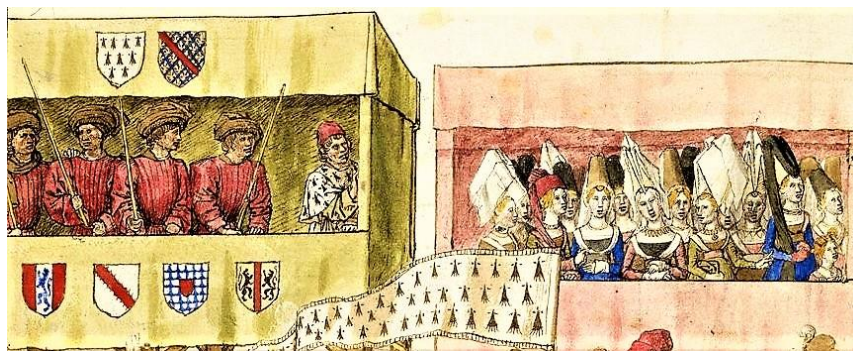
L'estrade des arbitres, et celle des dames, lavis sur papier par Barthélemy d'Eyck, vers 1462-1465, illustrant le Traité...des tournois , BnF, f° 76.

Une estrade plus petite était réservée aux quatre juges en robe longue, munis d'une baguette blanche, et aux deux hérauts d'armes. Une belle jeune fille accompagnait chaque « tenant » (l'un de ceux qui avaient défendu le passage), elle lui lisait un court texte, demandant entre autres d'éviter de blesser inutilement les adversaires. Plus tard, c'est elle qui devait remettre le prix au vainqueur. Chaque « appelant », qui avait donc accepté de relever le défi, entraînait en lice accompagné par la dame dont il s'était engagé à défendre l'honneur, celle-ci tenant la bride de son chevalier.