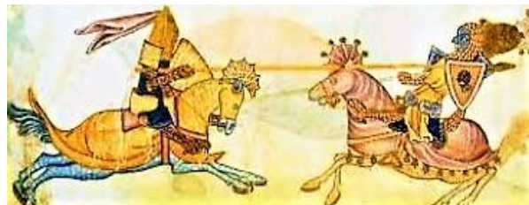
Dessin de B. d'Eyck, dans le Traité...des tournois , montrant le support placé sur le heaume, nécessaire au maintien du cimier (BnF, f° 59). Chevaliers au cours d'un assaut, avec leur tenue de parade.