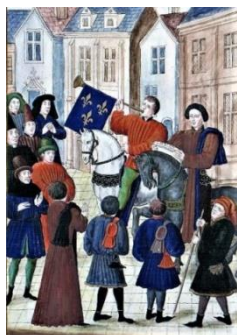
Un héraut d'armes dans les rues de Chinon (?).

Alors que dans d'autres Pas d'armes les combats, après un premier affrontement à cheval, continuent à l'épée avec un nombre limité de coups et des armes émoussées, on s'est limité à Razilly à une simple joute à la lance. Comme il s'agit ici du premier Pas mis en place par René d'Anjou, qui en organisa deux autres la même année dont l'un en juin, trois mois après celui de Razilly, et encore un à Bourges l'année suivante (4) avant de partir pour la Provence, on peut supposer que la Touraine lui a servi de mise au point pour le déroulement de ces fêtes désirables de rappeler les exploits des chevaliers de la Table ronde.