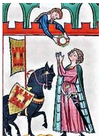
La remise du prix par la belle demoiselle choisie pour ce Pas d'armes.

Le Pas d'armes se termina par la remise du prix. Il n'y avait pas de classement en fonction du résultat des chocs, ceux-ci réussissant rarement à désarçonner l'adversaire, et au contraire se traduisant souvent par le bris de la lance. On récompensait plutôt un appelant et un défendant, en fonction de son « panache », de son succès auprès des dames et des spectateurs. Mais à Razilly le comte de Foix, qui avait vaincu lors de la dernière joute le comte de Beauvau et son heaume à la hure de sanglier, fut proclamé vainqueur, « comme étant celui qui avait le plus gagné de gants et de tourets ». La demoiselle au service des tenants lui remit un beau diamant (6).